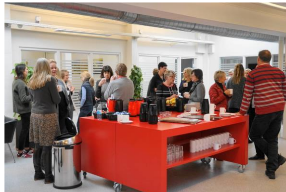
Stemningsbilleder fra temadagen.