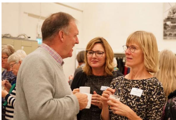
Vidensdeling og smalltalk