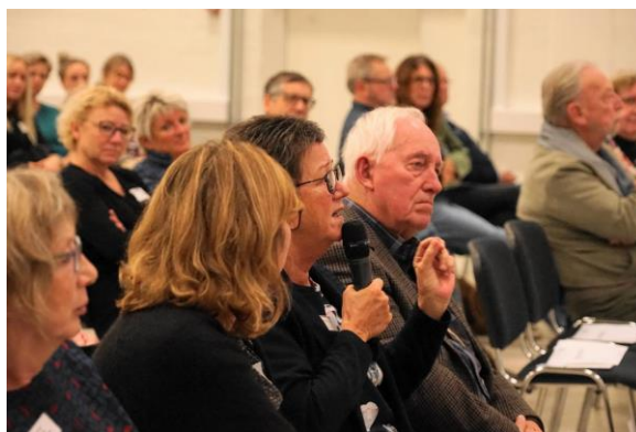
Spørgsmål fra salen