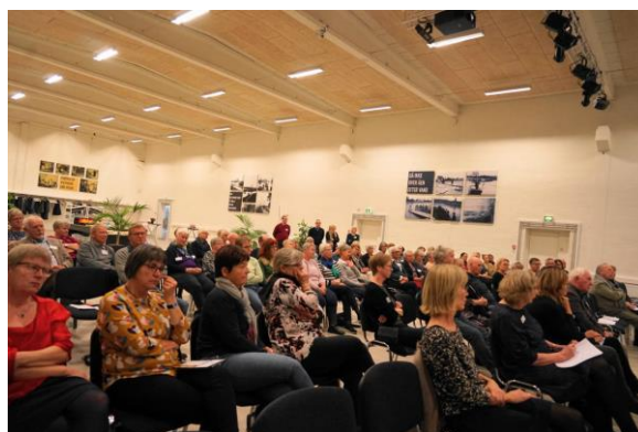
Stemmingsbillede fra salen